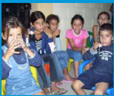
Kinderen drinken en eten wat na de zondagschool, vereniging of bij bijzondere diensten.