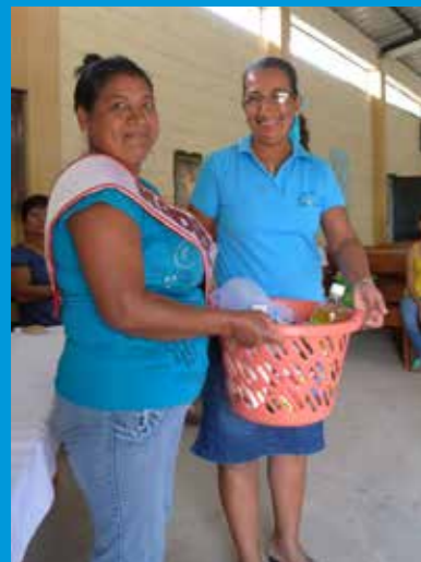
Elke maand krijgt een gezin uit de wijk een boodschappenmand. Deze mand wordt betaald uit het collectiegeld van de woensdagavonddiensten. Deze vrouw is er erg blij mee.