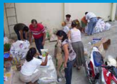
Oog hebben voor elkaar door met kerst voedselpakketten klaar te maken voor mensen in de wijk die het nodig hebben.

Hoe dragen gemeenteleden op de zendingsvelden zorg voor elkaar? Hoe gaat dat bijvoorbeeld in Ecuador?