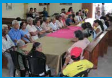
Net als bij de eerste christenen wordt er vaak samen gegeten in de kerk. Na bijvoorbeeld een doopdienst, belijdenisdienst of op een feestdag.

Welke activiteiten zijn er in jullie gemeente om aan je naaste dichtbij of ver weg te denken?