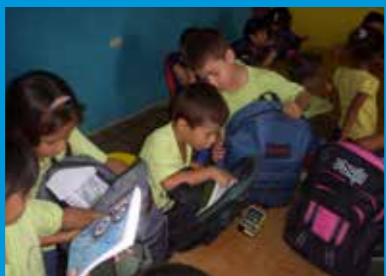
Kinderen bekijken hun rugtas. Aan het begin van een schooljaar moeten alle kinderen hun eigen schoolspulletjes kopen. Zoals een gum, stiften, schriften, potloden, pennen, enzovoort. Maar voor veel ouders is dit veel te duur.