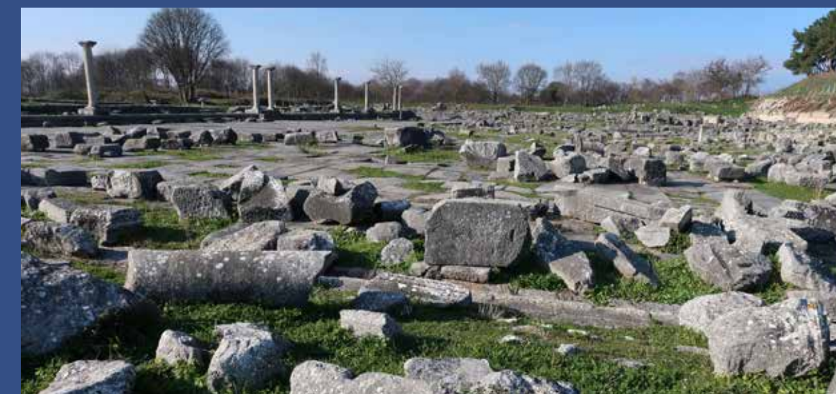
Overblijfselen van Filippi

In deze lesbrief gaan we nadenken over Paulus' laatste reis. Hij reist van Antiochië naar Efeze, Troas, Filippi, Korinthe en andere plaatsen. Na zijn derde zendingsreis wordt Paulus gevangen genomen. Als gevangene maakt hij de reis naar Rome. Pak de kaart in je Bijbel er maar eens bij en zoek Efeze, Troas en Rome op. In een lesbrief van de zending denken we ook na over het zendingswerk van nu.