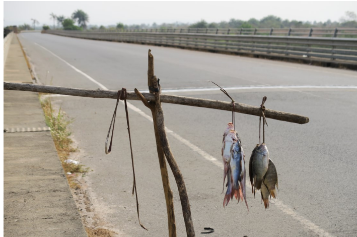
Verse vangst; eet smakelijk!

Bijna alle bovenstaande ideeën zijn ook toe te passen op de getallen van 1 t/m 20 in het Mogofin. Hiervoor is een geluidsfragment met de uitspraak beschikbaar.