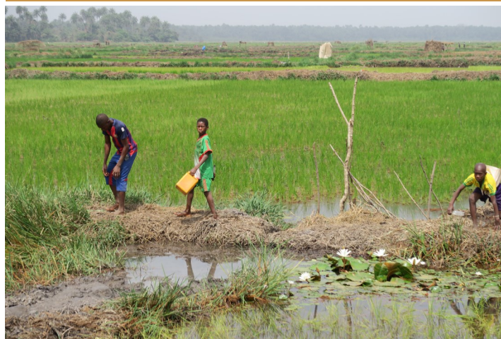
Groeiende rijst op de velden