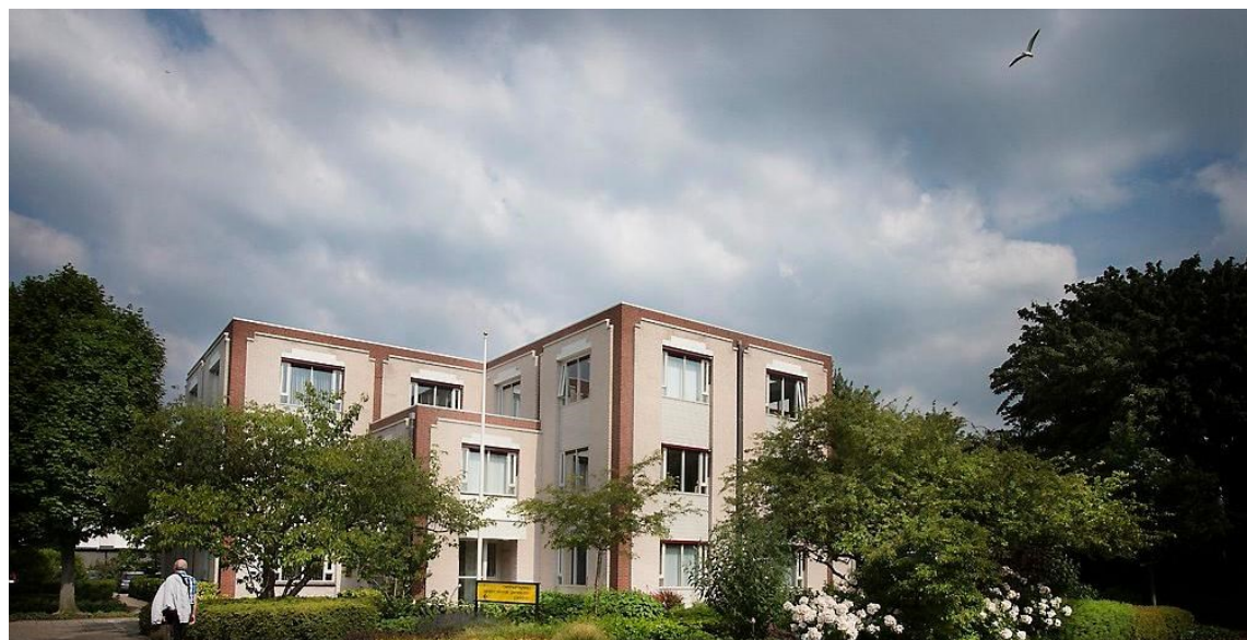
Het zendingsbureau is gevestigd in het Centraal Bureau voor de Gereformeerde Gemeenten in Woerden.

Onderhoud van contacten rond fondswerving, in het bijzonder ondernemers en kringloopwinkels.