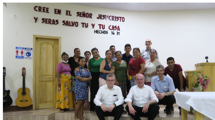
Visitatiebezoek in Ecuador (2022) en Albanië (2021).

'De aanleiding voor oriëntatie op een nieuw veld is verschillend. Voorbeelden hiervan zijn het zelfstandig worden van een zendingsgemeente of een vraag vanuit een andere organisatie of het eigen deputaatschap.'