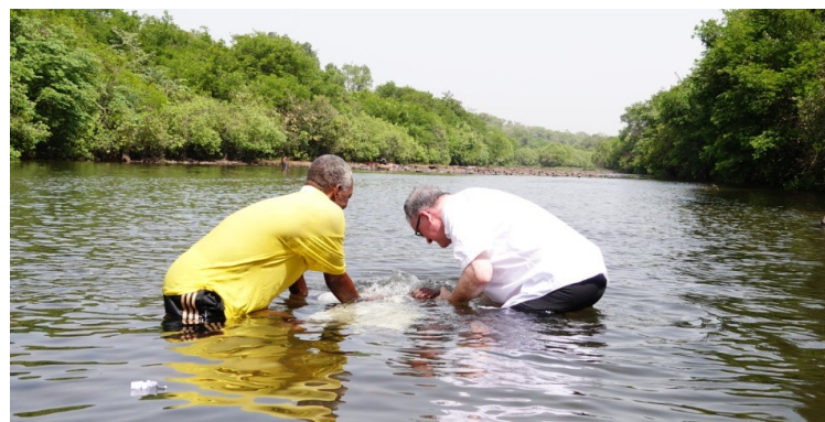
2022: doopdienst in Boké

In 2006 vestigt een zendingswerker zich in het dorp Coliah. Dit dorp wordt gezien als een belangrijke islamitische opleidingsplaats voor jongens: de koranschool staat goed bekend. Toch heten de dorpsleiders de zendingswerkers welkom en tonen ze belangstelling voor de 'Heilige Boeken'. Nadat een aantal jaar geen zendingswerkers in het dorp werkten, is nu een zendingsteam bezig met het leggen en onderhouden van relaties in het dorp en het verspreiden van evangelisatiemateriaal in de wijde omgeving van Coliah.