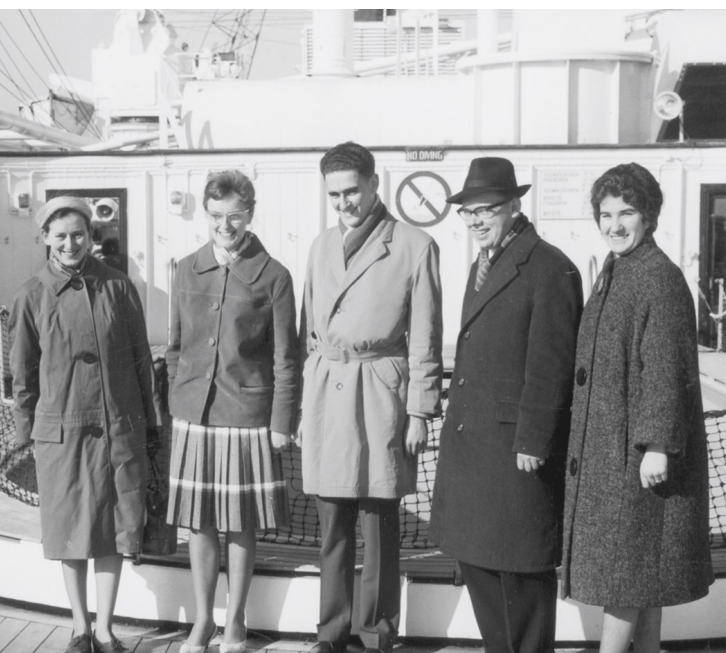
Het eerste zendingsteam van ZGG.

Het deputaatschap bepaalt de kaders voor het beleid en bestuurt op hoofdlijnen. Het zendingsbureau geeft dagelijks leiding aan het zendingswerk. Bovendien betreft het de leden van de Gereformeerde Gemeenten met voorlichting en publicaties bij het werk. Dat stimuleert om de zending te steunen met gaven en aan de werkers te denken in het gebed. Al het werk is financieel mogelijk dankzij de vele betrokkenen, vrijwilligers en bedrijven op het thuisfront.