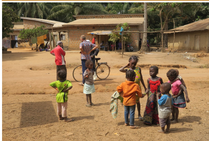
Dorpsleven in Coliah