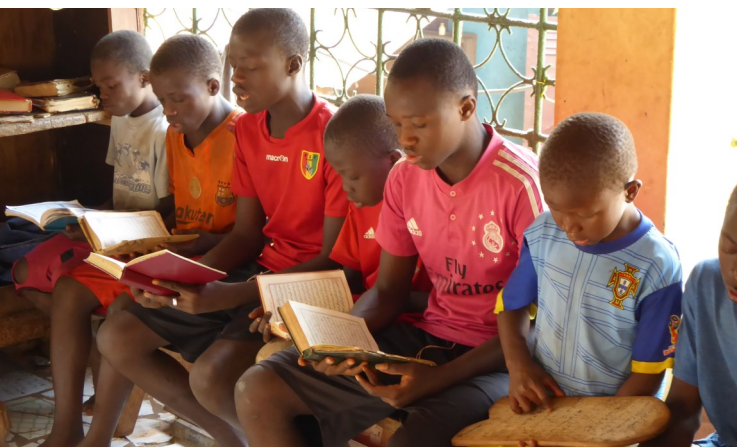
Koranonderwijs is alleen voor jongens.

Het zendingswerk van ZGG begint in 1991 onder de Soso-bevolking. Al snel breidt het werk uit onder de Mogofin-bevolking. Inmiddels werkt ZGG op drie plaatsen in Guinee. Een actueel overzicht van de zendingswerkers en hun taken is te vinden op www.zgg.nl/landen/guinee/zendingswerkers .