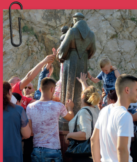
Allemaal het beeld aanraken om zegen te ontvangen

Welke verschillen zie je tussen de foto's? Welke mensen dienen de Heere? Hoe zie je dat?