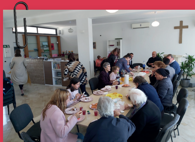
Samen eten na de kerkdienst