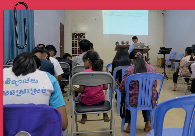
Samen luisteren naar de preek