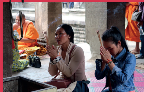
Samen knielen voor boeddha