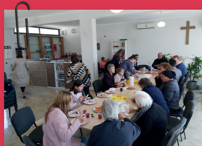
Samen eten na de kerkdienst