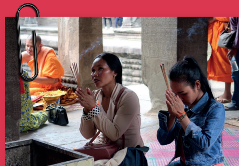
Samen knielen voor boeddha