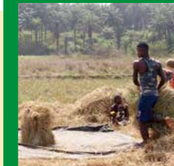
Er worden een paar schoven op de dorsvloer gezet.

Op het zandingsveld in Guinee lijkt het werk op de akker nog wel een beetje op de tijd van de Bijbel. Op de foto's zie je hoe rijst geogst wordt.