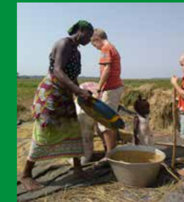
De goede rijstkorrels worden verzameld en in zakken gedaan.