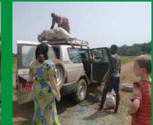
De oogst wordt bovenop de auto meegenomen naar huis. Lekker makkelijk!