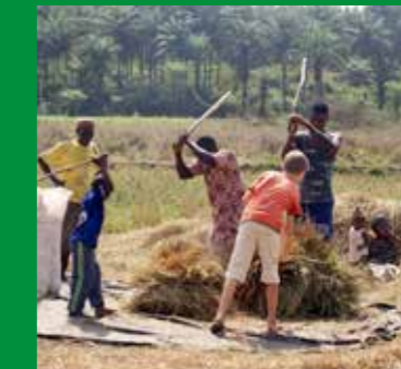
Met stokken slaan we op de schoven zodat de rijstkorrels op de dorsvloer vallen.