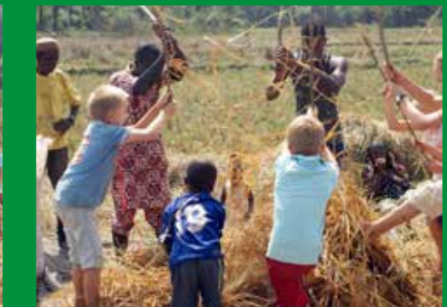
We slaan allemaal zo hard mogelijk. Zie je de stengels van de rijstplant door de lucht vliegen?